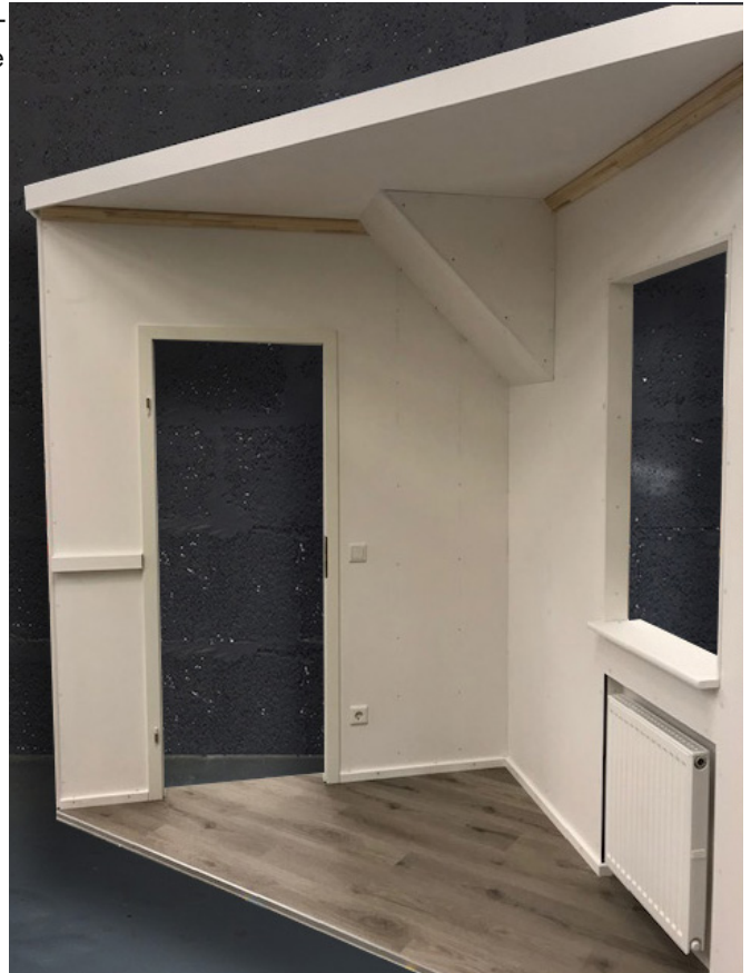
Kabine mit Türöffnung Standard, Fensterleibung, Heizkörper, Dachgaube, Fußleiste, Stuck, Kabelkanal, Steckdose und Fallrohr