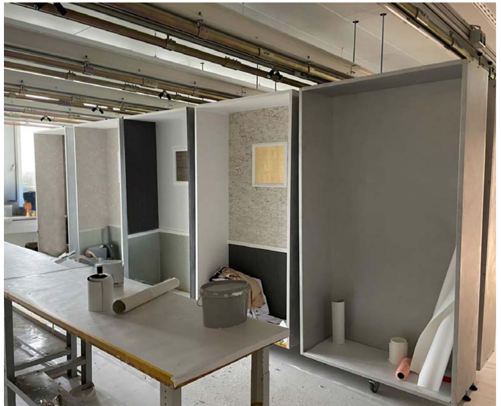
Standard Malerübungskabinen im Decken-Laufschienensystem