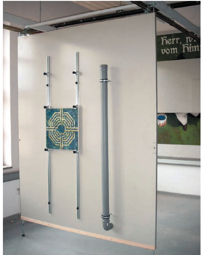
Malerübungstafel mit Vorhangschienen und Zusatzmodul „Rohrelement“.

Alle Tafeln sind bereits standardmäßig mit bündig eingelassenen Aufnahmehülsen innerhalb der Arbeitsflächen versehen, zur Befestigung der verschiedenen Zubehör-Elemente.