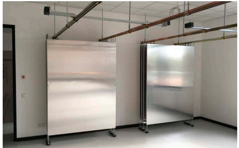
Malerübungstafeln im „Sandwich“-System