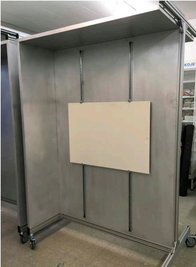
Malerkabine in Alu-Ausführung mit Vorhangschienen zur flexiblen Plattenaufnahme