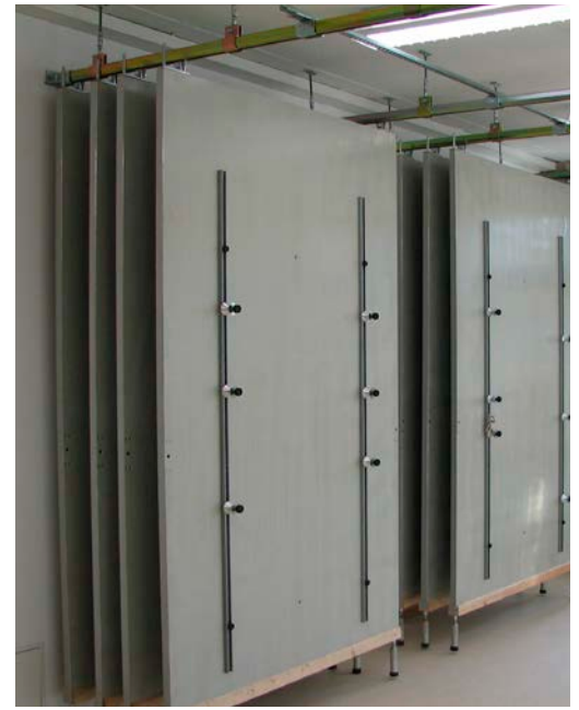
Malerübungstafeln mit Decken-/Schienenaufhängung