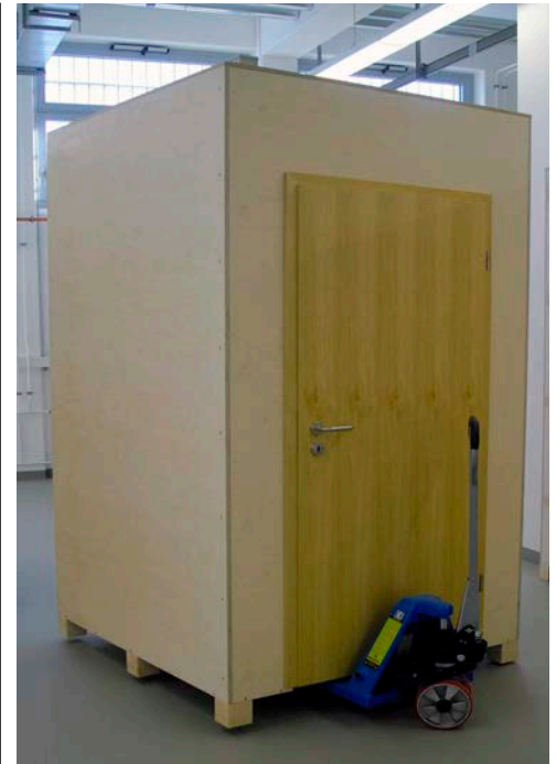
Malerübungskabinen, geschlossene Bauweise, mobile oder stationäre Ausführung