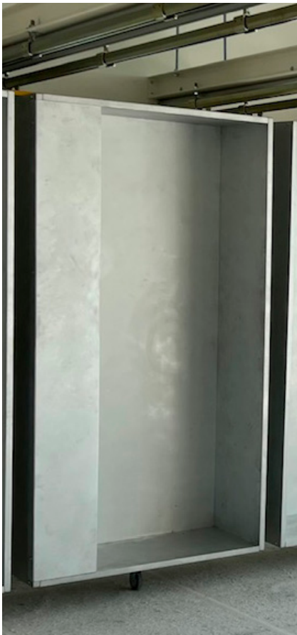
Malerübungskabine mit Außenecke