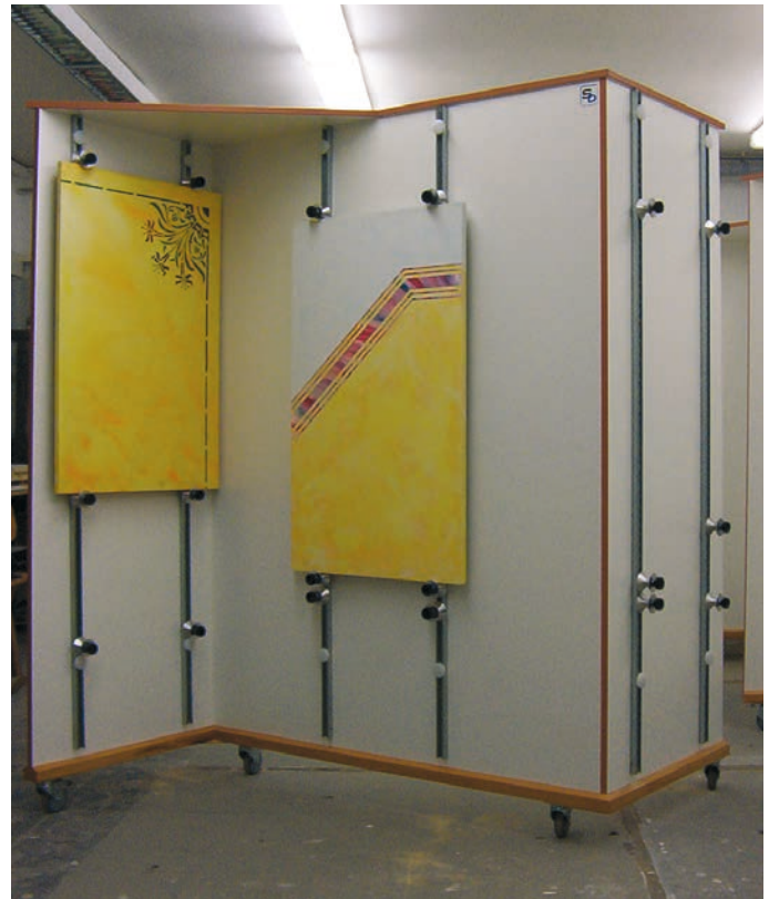
Die Abbildung zeigt das Modell Nr.200670 (doppelseitig nutzbar), mit eingeschraubten Vorhangschienepaaren Nr. 200920 mit eingehängten Übungsplatten.

Alle Wände sind standardmäßig mit bündig eingelassenen Aufnahmhülsen innerhalb der Arbeitsflächen zur Befestigung verschiedener Zubehöre versehen, wie z.B.: der Vorhangschiene oder zur Aufnahme von Ergänzungsmodulen zur Übungserweiterung.