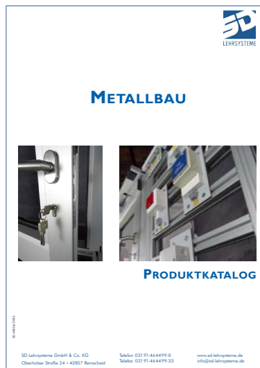
Metallbau/Schließ- und Sicherheitstechnik