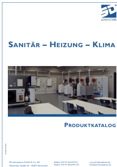
Sanitär – Heizung– Klima

Fordern Sie Ihren gewünschten Fachbereichskatalog an!