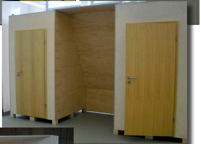
Beispiel: 2 Malerkabinen mit Zwischenelement „Dachschräge“