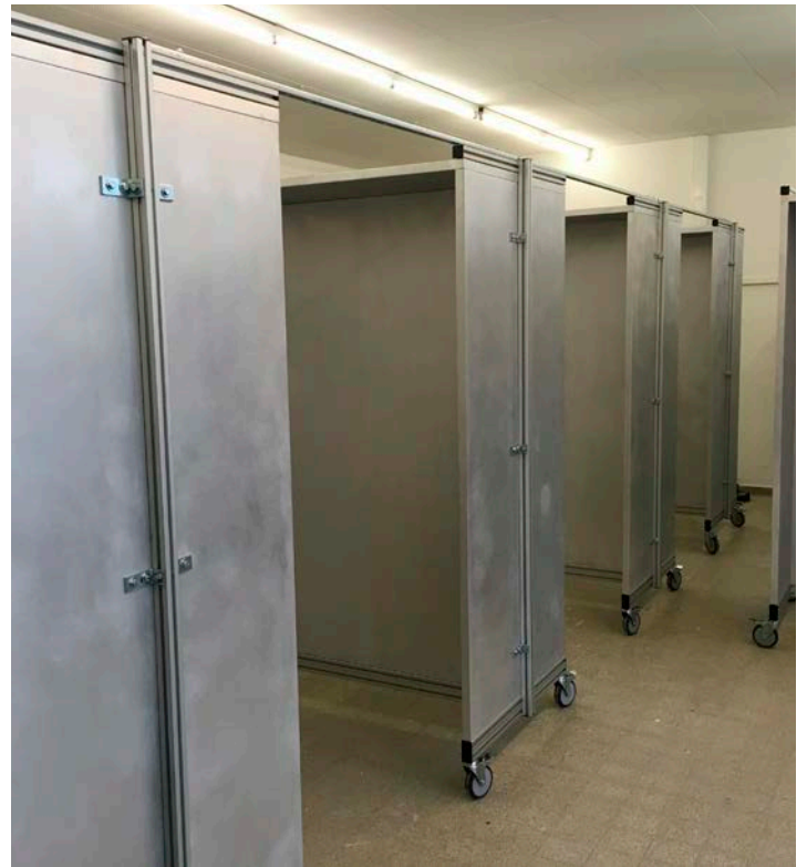
Malerübungskabinen mit Alu-Arbeitsflächen, doppel-seitig nutzbar, für 2 Arbeitsplätze