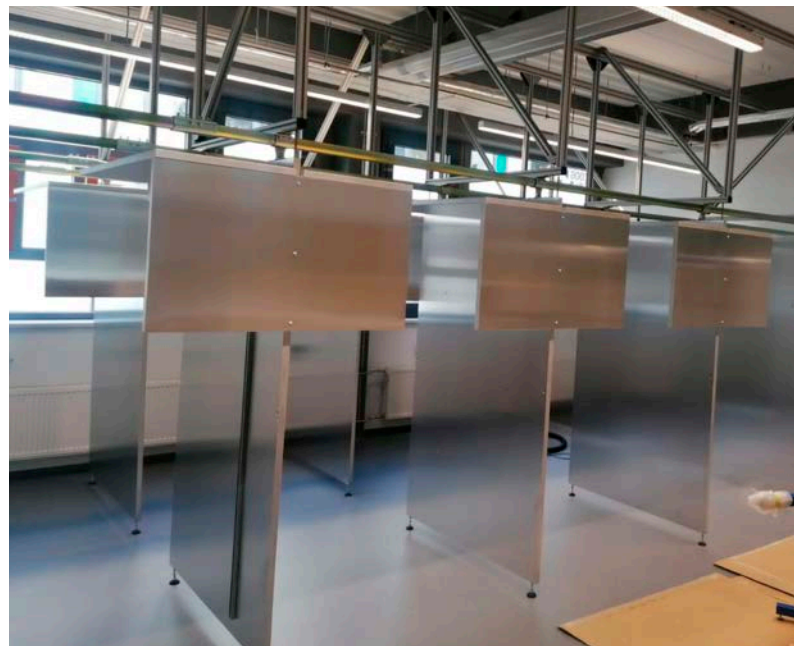
Malerübungstafeln mit Deckenkonstruktion in Fachwerkausführung mit Decken- und Eckenelement